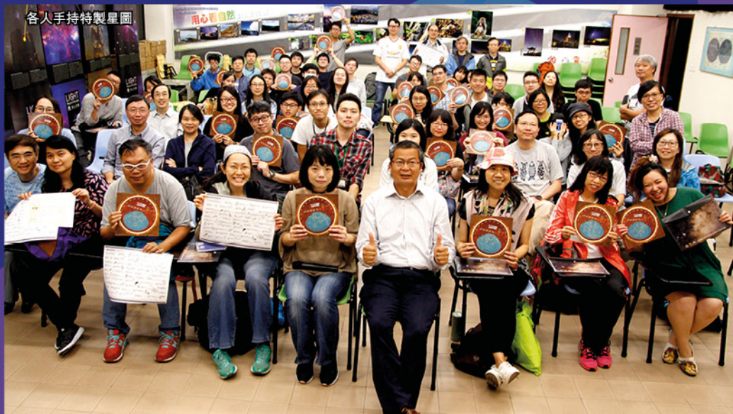
各人手持特製星圖