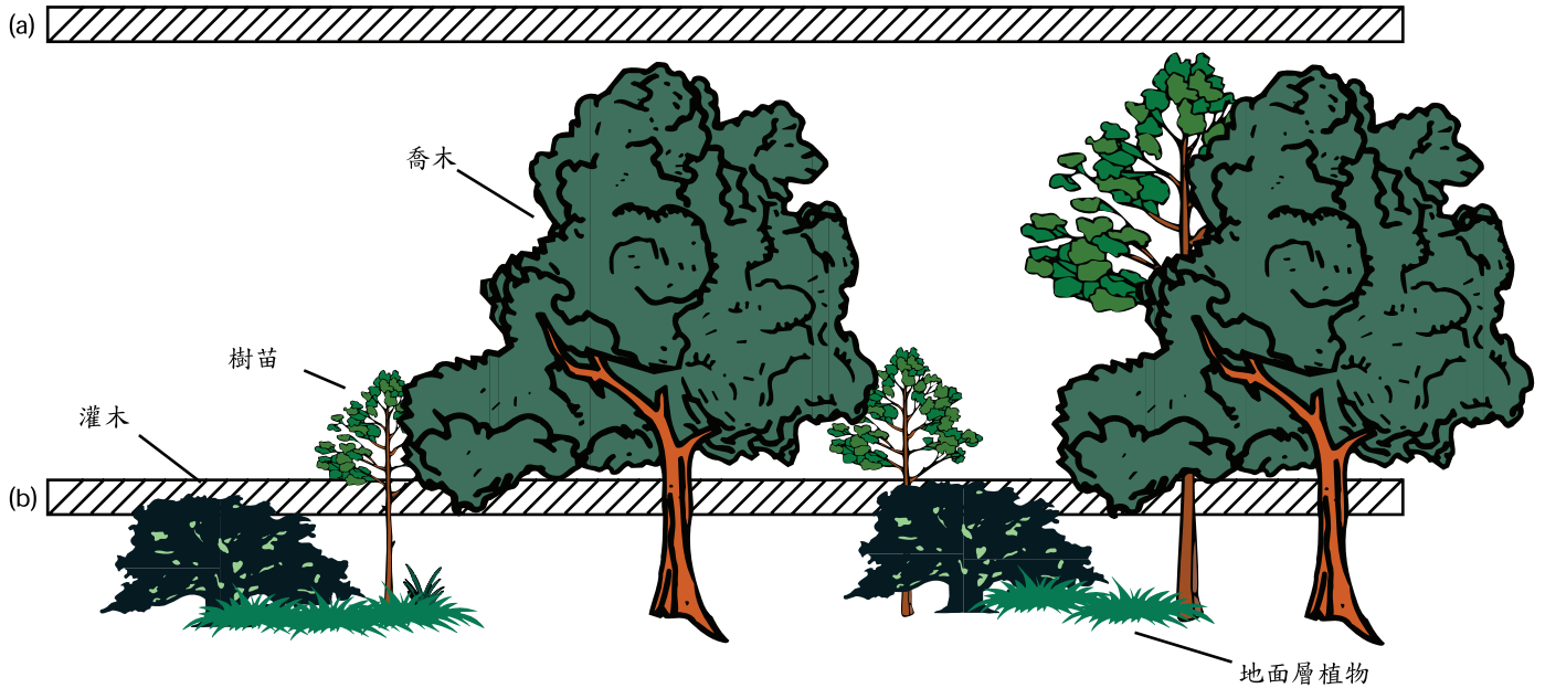
圖 5.4 - 樹林內植物之分層