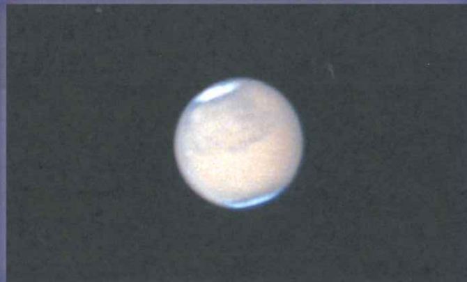
自古以來火星都惹人好奇，故此又稱熒惑

火星將會成為下半年天空的主角，直至12月尾上演另一精彩的天象—木星合土星。木星和土星自7月份開始，便是一對明亮又要好的拍檔，而且一天比一天提早與大家會面。有趣的是到12月22日，木星和土星會互相靠近至相距僅 0.1^\circ ，看起來兩大行星接近得「難分難解」，稱為木星合土星。由於兩者軌道的公轉周期關係，此天象逾20年只出現一次，實在不容錯過。