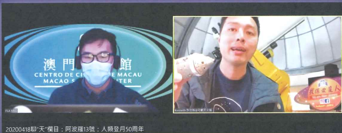
20200418聊“天”欄目：阿波羅13號：人類登月50周年