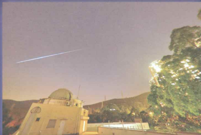
流星雨雖然每年都出現，但是表現不一，耐心等待是良策

踏過夏至，庚子年已過了一半，但在餘下的半年，精彩的天文現象陸續有來，充滿驚喜的流星雨、絳紅奪目的火星衝、廿年一遇的木星合土星，這些有趣又珍貴的天象將一一與大家見面。