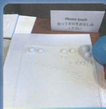
凸字赫羅圖 Hertzsprung - Russell diagram

意思是把數據透過某種演算法轉換為聲調(如音叉)或音樂(如樂器)，例如圖中所示是利用程式以聲調把星體光度變化呈現。