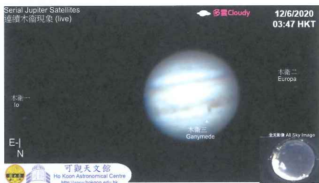
在網上直播6月11至12日的連續木衛現象

香港人的生活在疫情下大受影響，自2月起學校更經歷長達數月的停課期。本園轄下可觀自然教育中心暨天文館為在家抗疫的學生及公眾人士提供不同渠道的網上天文學習活動，讓大家足不出戶仍可遙窺宇宙的奧秘。